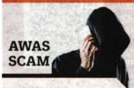
DARI MUKA 1

Menurutnya, Selangor pula mencatat jumlah kes tertinggi iaitu 71 kes.