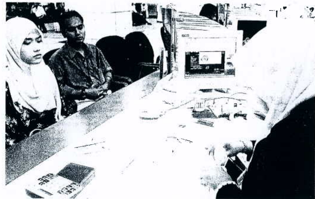
SAAT melangkah ke alam pekerjaan juga menjadi titik permulaan mencarum di dalam Kumpulan Wang Simpanan Pekerja (KWSP) untuk kegunaan selepas persaraan.

Untuk menetapkan matlamat kewangan, anda perlu tahu dari mana punca kewangan atau pendapatan anda dan ke mana pula ia akan mengalir