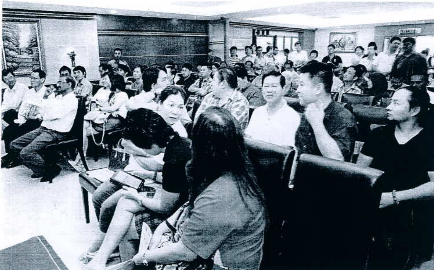
BAHANG majlis lelong adakalanya berterusan hingga ke akhir majlis bergantung kepada minat pembida menawarkan harga yang berpatutan.

Nombor pendaftaran pembida itu tertera atas padel tersebut dan pembida akan dipanggil menerusi nombor berkenaan.