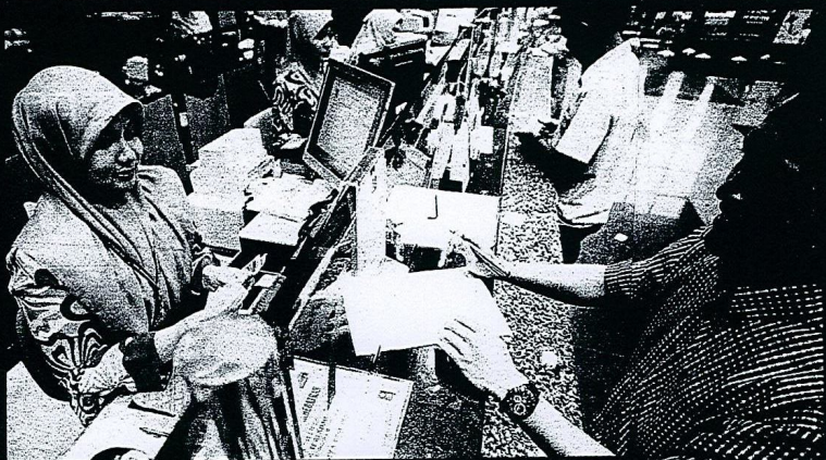
PEMINJAM harus bertanggungjawab melunaskan hutang dengan pihak bank.

Ansuran bulanan perlu dibayar ikut jadual, elak masalah