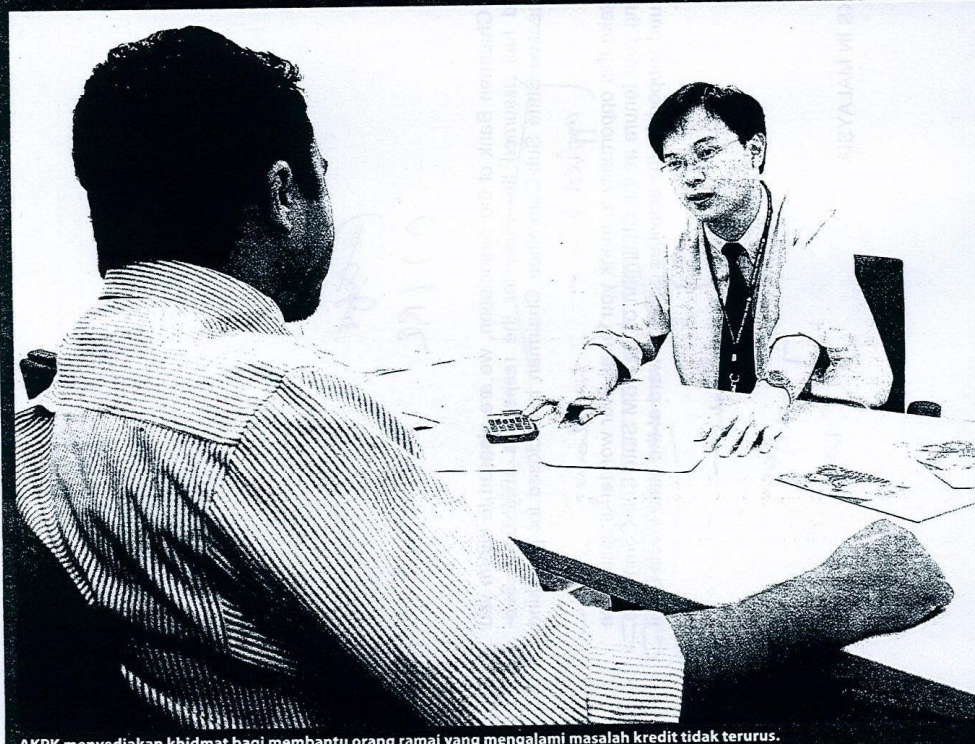
AKPK menyediakan khidmat bagi membantu orang ramai yang mengalami masalah kredit tidak terurus.

Pinjaman dikendali dengan baik mampu bawa kebaikan, masa depan lebih stabil